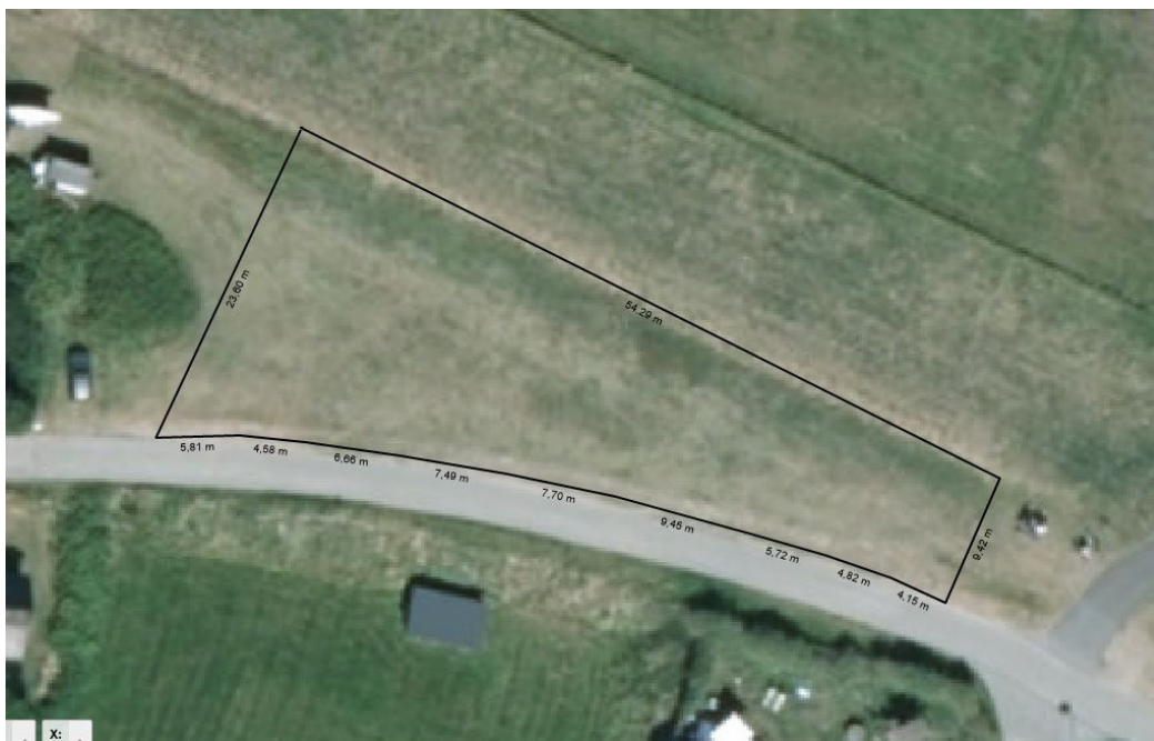
Området set fra oven

I det følgende præsenteres et skitseforslag til Sønderho ved norddiget. Området er i udkanten af byen og består af et ca. 800 m 2 græsareal som grænser op til Digevej på den ene side, diget og vadehavet på den anden side samt en vej der fører hen over diget. Fra området har man udsigt til Esbjerg, Ribe, Vadehavet og den kommende indsejlningskanal til Sønderhos lystbådshavn.