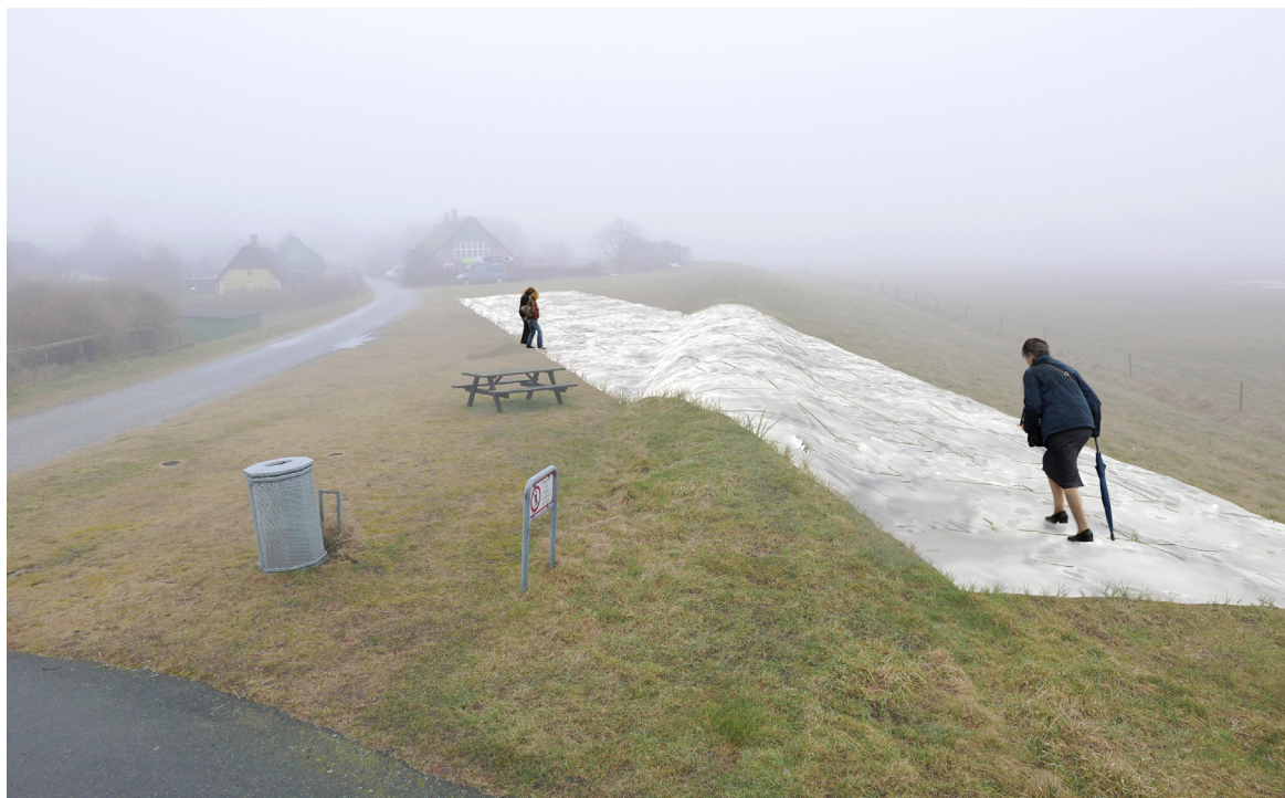
Visualisering af værket set fra vejen som går over diget.

Skitseforslaget Den hvide løber består af en hvid marmorbane som anlægges som en form for løber i jorden og placeres på tværs af pladsen og diget. I marmorens overflade vil der blive fræset det direkte aftryk af den jord/græsoverflade, som det erstatter og vil ligge i samme plan som det omkringliggende landskab og følge digets form. Løberens retning er mod Ribe. Værket vil være mellem 55-65 meter langt og 4-5 meter bredt og består af ca. 150 marmorfliser som hver måler ca. 1 m x 1,5 m x 0,12 m.