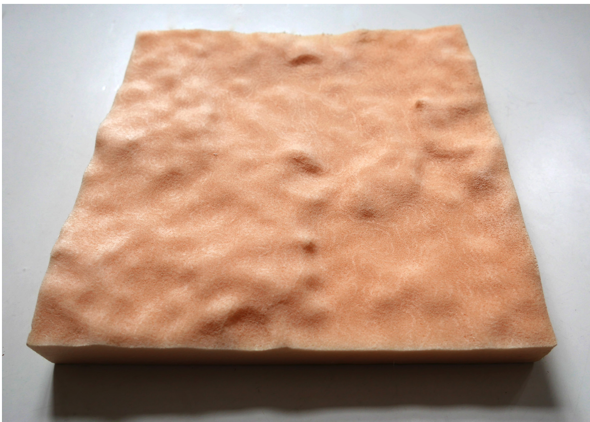
Testudfræsning af overfladen på marmoren. Fræset i 1:1 i skum. Måler ca. 25 cm x 25 cm.