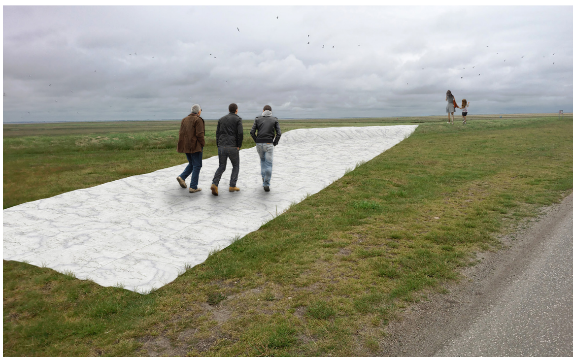
Visualisering af værket set fra digevej.